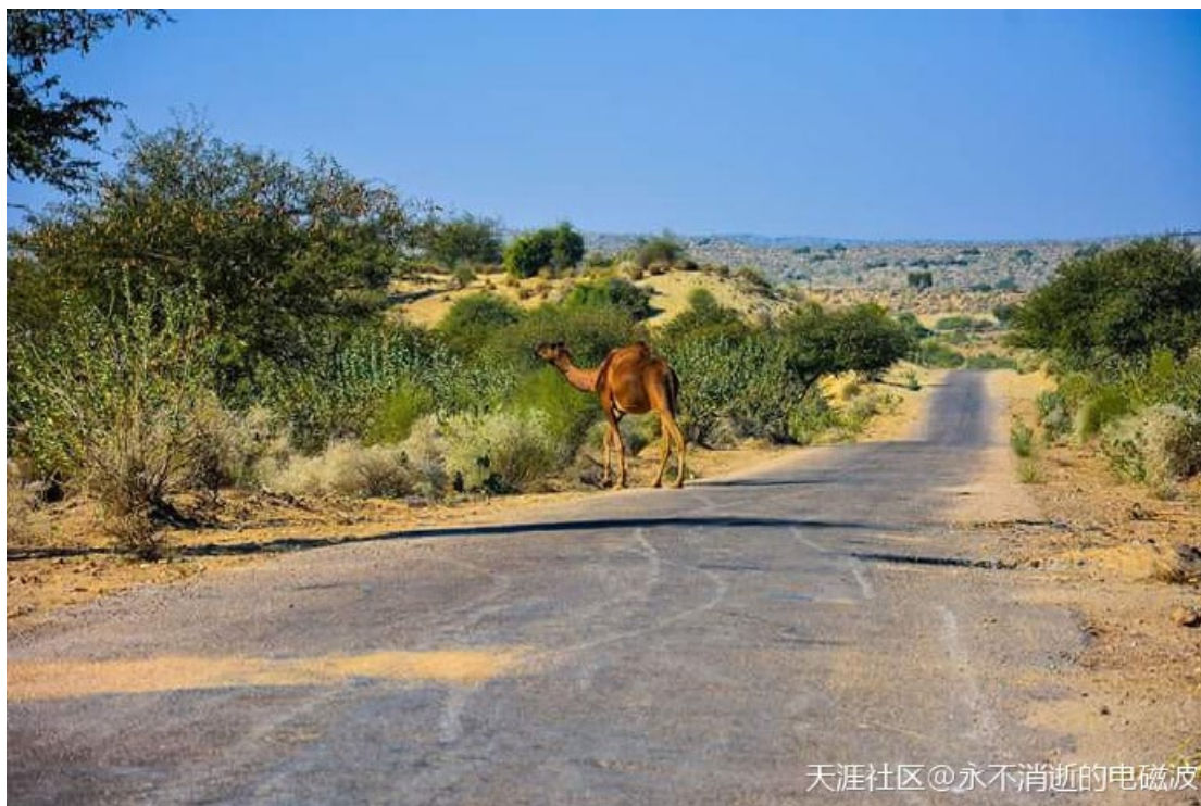
天涯社区@永不消逝的电磁波