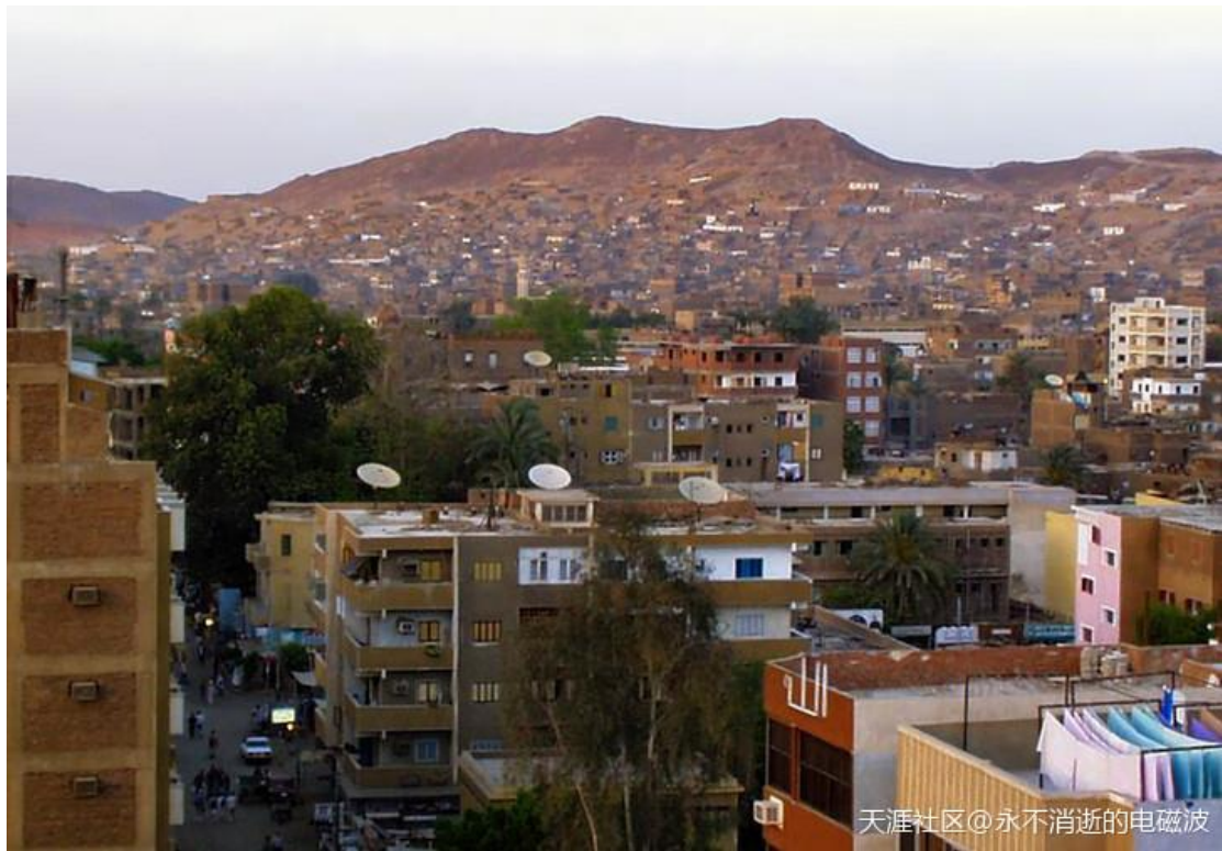
天涯社区@永不消逝的电磁波