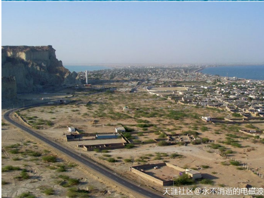
天涯社区@永不消逝的电磁波