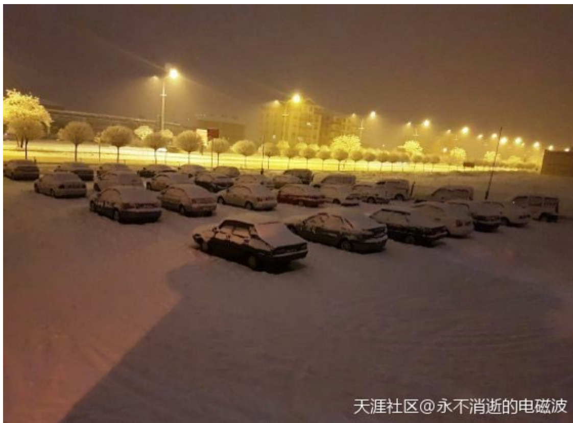
天涯社区@永不消逝的电磁波