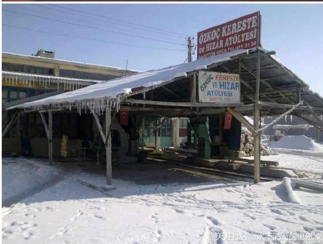
天涯社区@永不消逝的电磁波