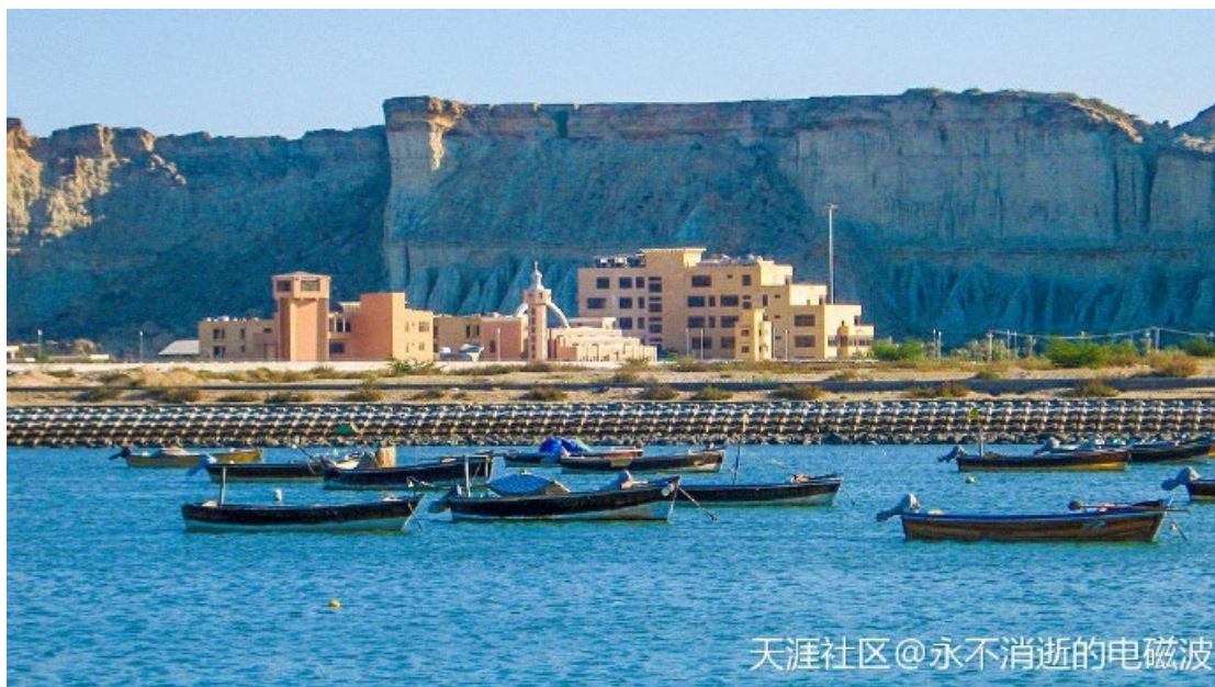
天涯社区@永不消逝的电磁波