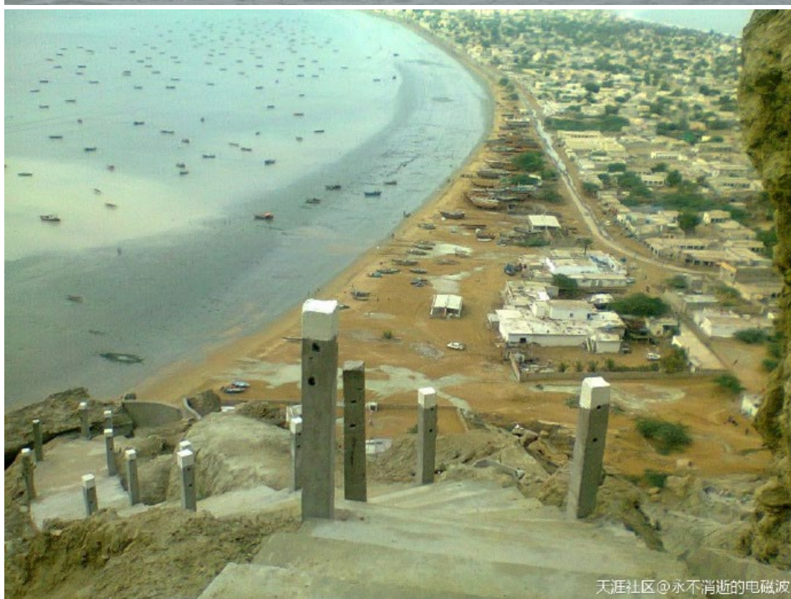
天涯社区@永不消逝的电磁波