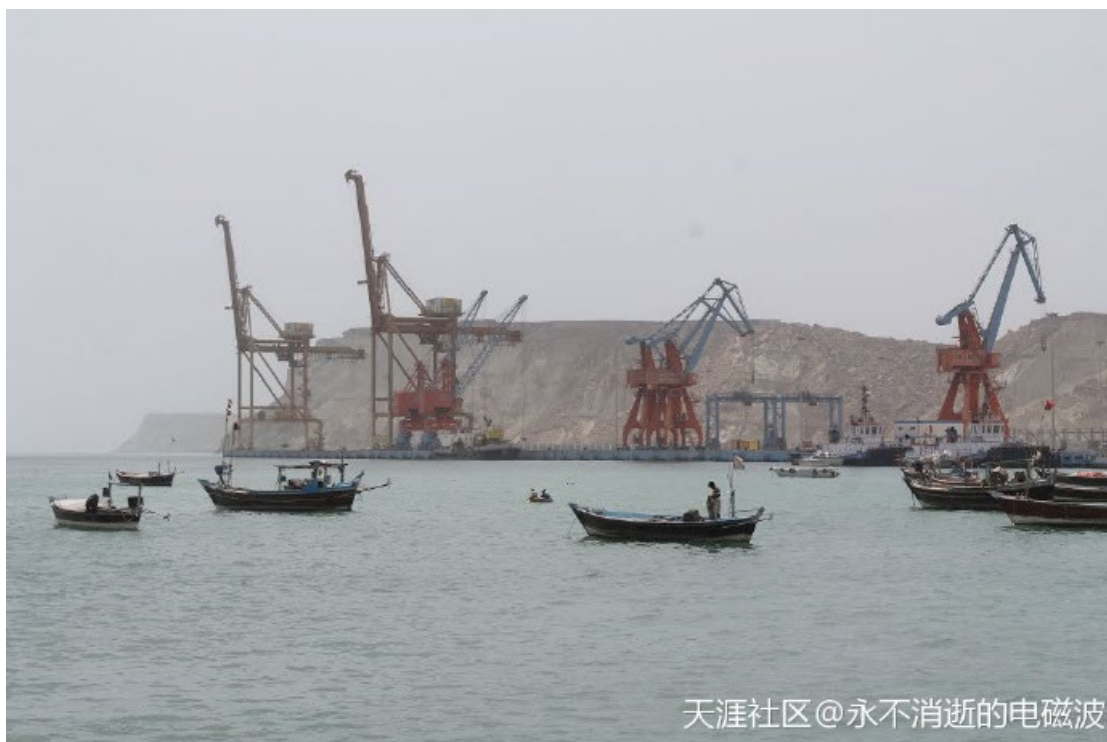
天涯社区@永不消逝的电磁波