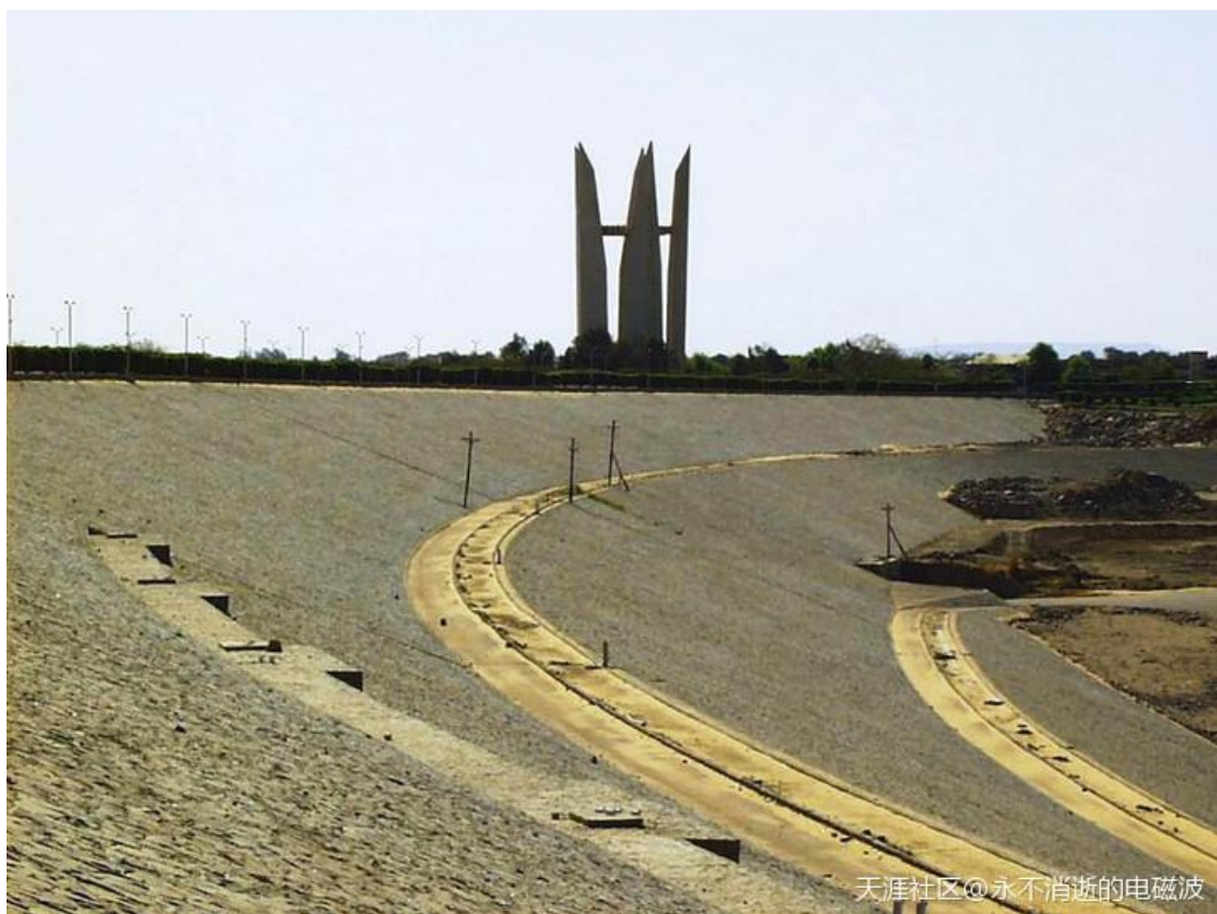
天涯社区@永不消逝的电磁波